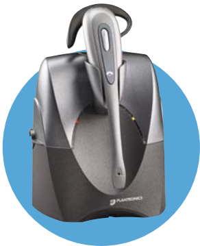
CS60 Für alle Umgebungen